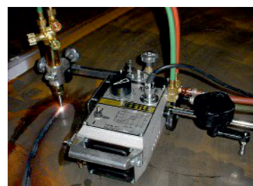
Circle cutting attachment