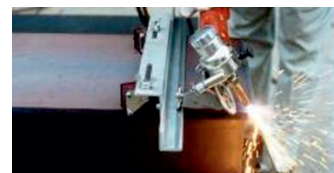
Straight guide rail 500 mm